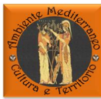
Ambiente Mediterraneo Cultura e Territorio

SALERNO, 21 marzo 2014, ore 15,30 GRAND HOTEL SALERNO